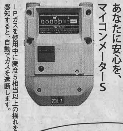
LPガスを使用中に震度5相当以上の揺れを感知すると、自動でガスを遮断します。